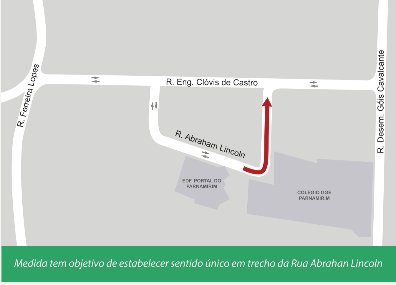
Medida tem objetivo de estabelecer sentido único em trecho da Rua Abraham Lincoln

A partir deste sábado (30), a Prefeitura do Recife, por meio da Secretaria de Política Urbana e Licenciamento e da Autarquia de Trânsito e Transporte Urbano (CTTU), implantará uma mudança de circulação no bairro do Parnamirim, na Rua Abraham Lincoln. Com a mudança, o trecho entre os números 111 e